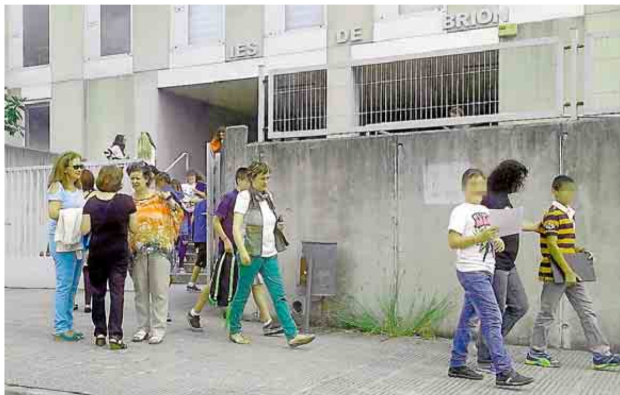
Salida de alumnos ayer a mediodía del Instituto de Secundaria de Brión, que volverá a abrir hoy sus puertas.