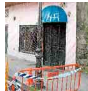
Farola de Ribeira

La imputación de dicho empresario derivó en un juicio de faltas por presunta imprudencia leve y finalmente fue absuelto; la compañía de seguros de su empresa indemnizó a la familia de la víctima con una cuantía superior a los cien mil euros. SUSO SOUTO