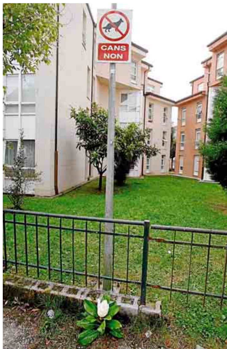
LA CAUSA del siniestro parece estar en la humedad del suelo, un fallo en la instalación eléctrica y que la joven tocó al mismo tiempo la farola y la barandilla metálica.

Todo indica que la niña recibió la fatal descarga al tocar a la vez una barandilla metálica y el báculo de la luminaria // La instalación fue revisada en 2011 y tenía el certificado vigente