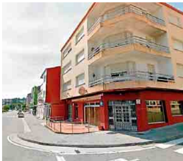
El bar Quinsar, derecha, en la carretera a Muros.

amaianas, la dirección del instituto de Brión confirmaba que finalmente no se van a suspender hoy las clases, "porque desde la inspección educativa advertíronnos que no podíamos pechar". Pero, de cualquier modo, facilitarán el viaje para los compañeros de