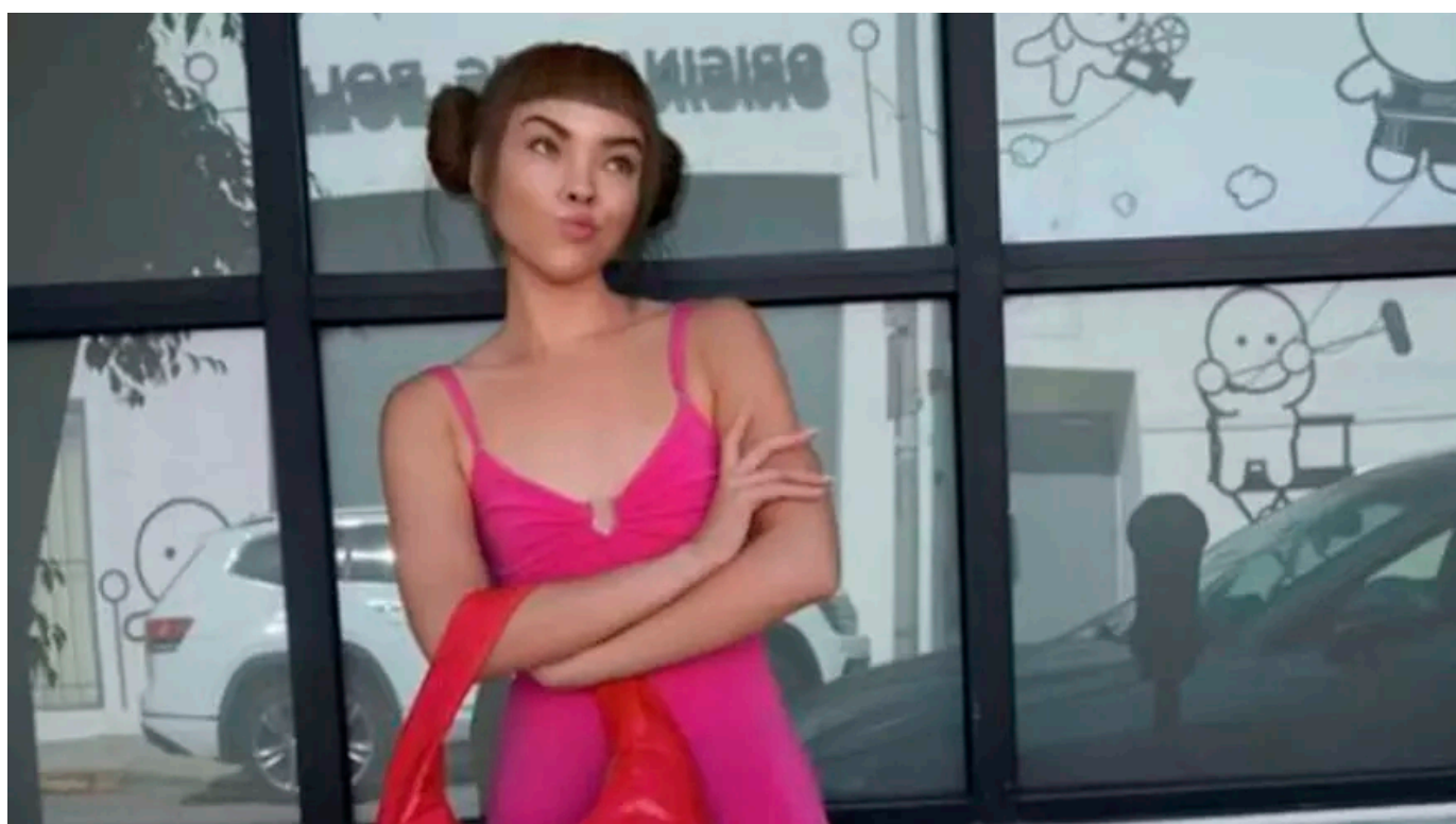
Lil Miquela es una modelo de IA.