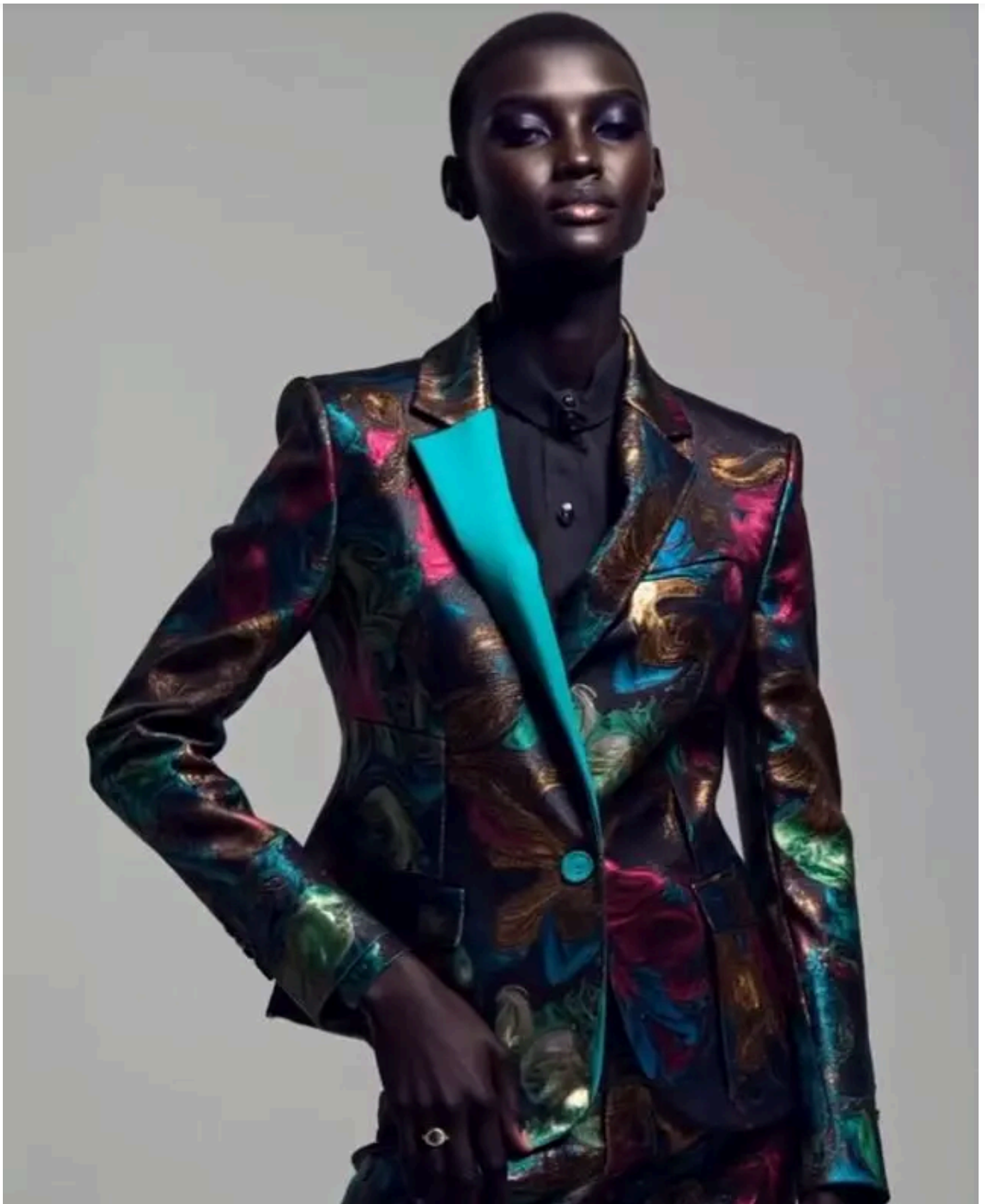
Shudu Gram, modelo generada por IA, tiene su propia cuenta de Instagram.