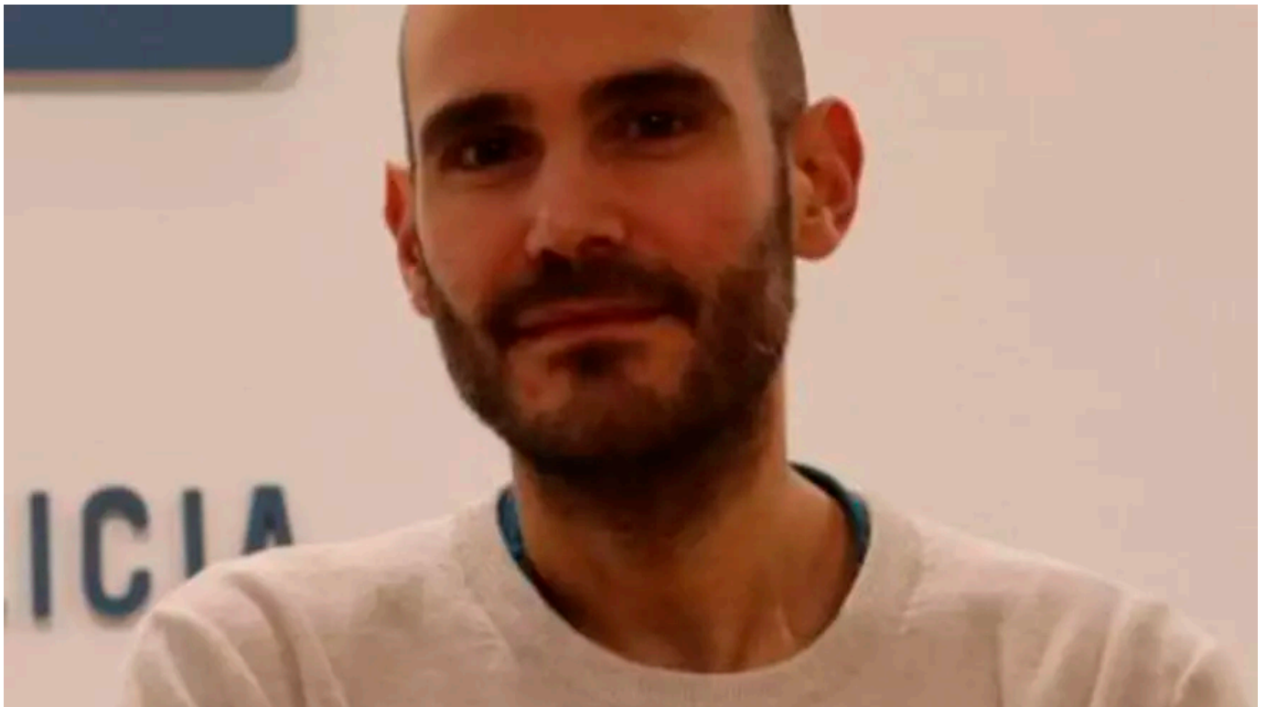
Las dos caras del 'hashtag' «más real»