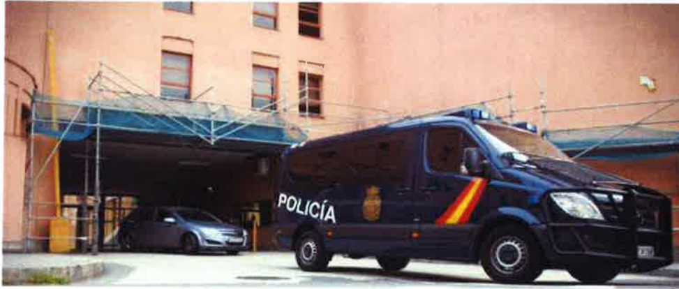
Comisaría de A Coruña.