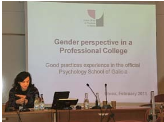
Momento do Seminario

Do 2 ao 5 de febreiro tivo lugar en Umea (Suecia) o III Seminario Internacional do Proxecto WEED, baixo a temática “Mulleres no coñecemento” no que se levou a cabo un intercambio e desenvolvemento de propostas concretas das cidades participantes no proxecto co fin de promocionar as oportunidades de desenvolver, utilizar e conservar as habilidades das mulleres nunha economía baseada no coñecemento, especialmente en sectores nos que actualmente están subrepresentadas.