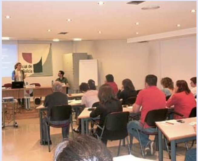
Momento do Curso

No transcurso do curso realizouse unha exposición teórica seguida do análise de casos clínicos, promovendo a participación dos/as asistentes ao mesmo. O obxectivo do curso foi profundizar no estudo do cuestionario de personalidade MMPI-2, desenvolvendo os principios teóricos xerais, así como a súa aplicación e interpretación a través de casos clínicos concretos.