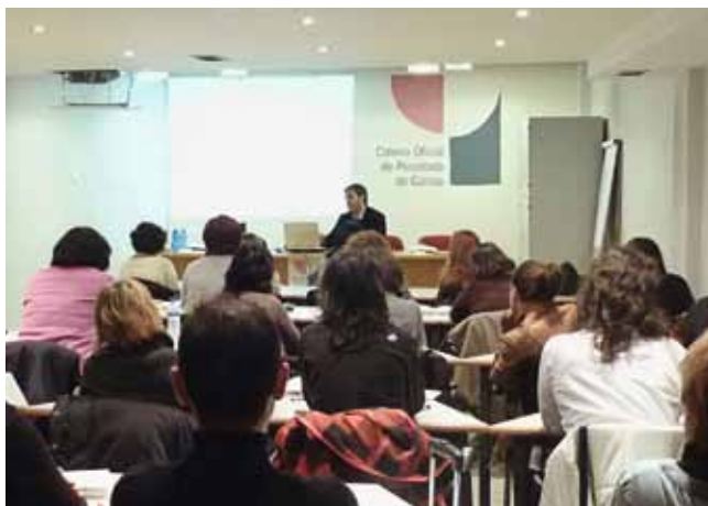
Momento do curso

Os obxectivos do curso foron, entre outros, facer unha aproximación ao coñecemento práctico das intervencións ante o risco de suicidio, facer unha inmersión na intervención psicolóxica ante as condutas suicidas e na intervención cos familiares, identificar e aprender a avaliar o risco de suicidio e coñecer modelos de prevención para a conduta suicida.