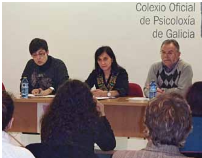
Momento da Asemblea

Tamén se aprobaron os orzamentos do COPG para 2012, que este ano introducen por primeira vez trala reforma do artigo 5 dos Estatutos do COPG en 2010, cotas especiais para colexiados e colexiadas xubiladas e asociadas.