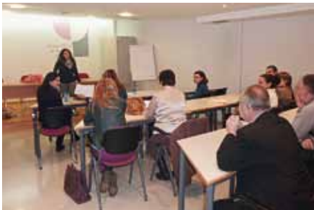
Momento do acto

Por último, deuse paso a un espazo de lectura de diversos textos, propios ou doutros autores e autoras, por parte dos asistentes que así o desexaron.