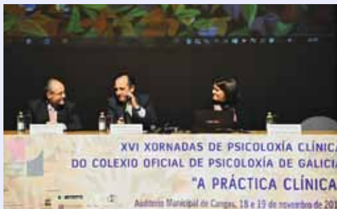
Acto de inauguración