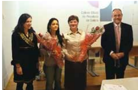
Momento da entrega de premios