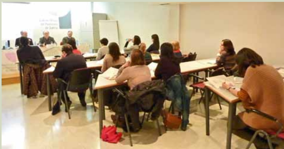
Momento da Xornada