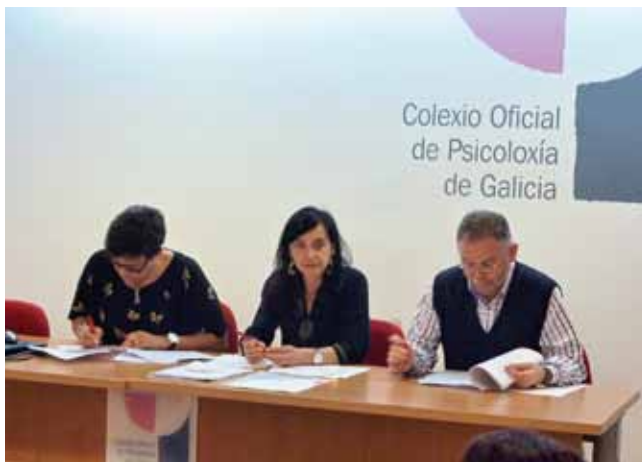
Momento da Asemblea

O 27 de marzo tivo lugar na sede do Colexio Oficial de Psicoloxía de Galicia sesión ordinaria da Asemblea Xeral de Colexiados e Colexiadas do COPG. Nela aprobáronse a Conta de Resultados e o Balance de Situación a 31 de decembro de 2011 así como a Memoria de Actividades do Colexio en 2011.