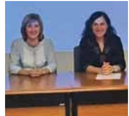
Momento da charla