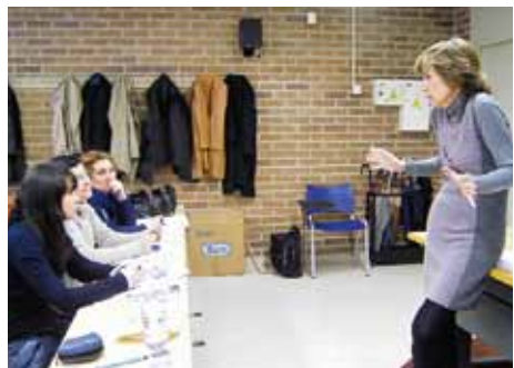
Momentos do Curso de Comunicación