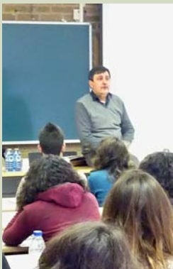
Momento do curso “Psicoloxía criminal, risco e perfilación psicolóxica”

A afiliación como membro ordinario da División de Psicoloxía do Traballo, das Organizacións e dos Recursos Humanos segue aberta sen data límite. Invítase aos colexiados e colexiadas do COPG a inscribirse na mesma. Podes tramitar a túa inscrición no enlace www.cop.es/ptorh/ .