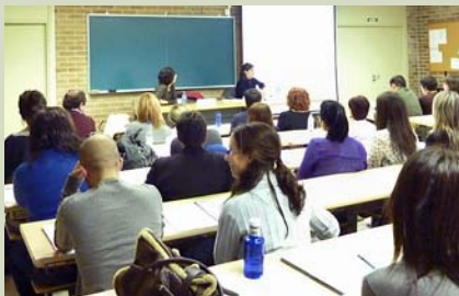
Momento do curso