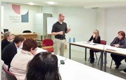
Momento do curso