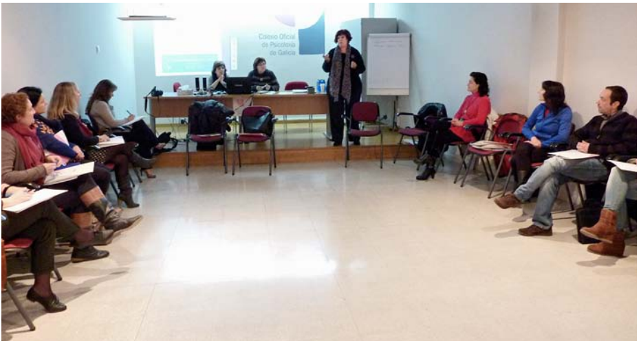
Momento da Xornada

A xornada aproveitouse tamén para facer por primeira vez unha reunión cos integrantes do GIPCE asistentes. Esta reunión terá carácter anual e a súa finalidade será a de informar directamente sobre temas de interese interno, recoller propostas e solventar dúbidas.