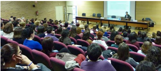
Momento da mesa redonda

O 11 de xaneiro celebrouse no salón de actos da Facultade de Psicoloxía da Universidade de Santiago de Compostela a Mesa Redonda “Confidencialidade: Hai que gardar segredo sempre?” organizada pola Comisión de Ética e Deontoloxía do COPG como peche do ano 2012 que no Colexio tivo como lema “Pola Ética”.