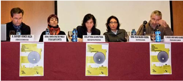
Momento do conversatorio