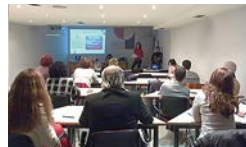
Momento da Xornada celebrada o 15 de febreiro