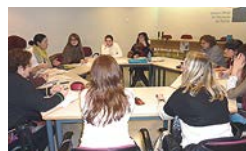
Reunión do grupo de gardas