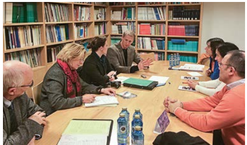
Momentos da reunión

Os tres expertos suecos realizaron cuestións sobre o dispositivo de asistencia psicolóxica, que se prestou en todos os puntos sensibles: no lugar do sinistro, nas estacións de tren de