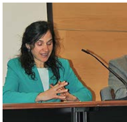
Momento dos actos