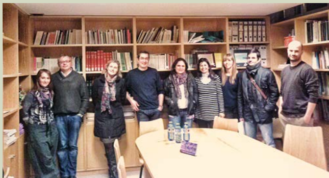
Novos membros da Xunta Directiva da Sección de Psicología e Saúde

A información que aparece neste apartado é elaborada e remitida por cada Sección, Comisión ou Grupo de Traballo do COPG tendo como data límite o 15 de cada mes par.