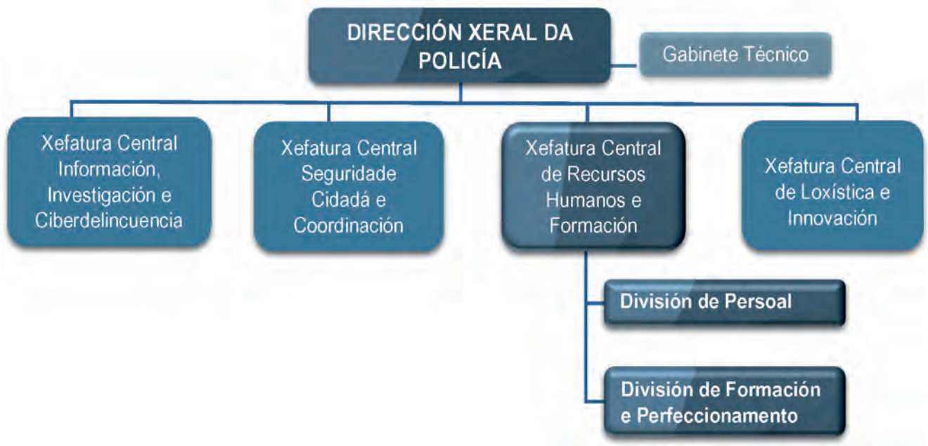
Figura 5. A psicoloxía policial na estrutura do Corpo Nacional de Policía. Real Decreto 770/2017, de 28 de xullo.