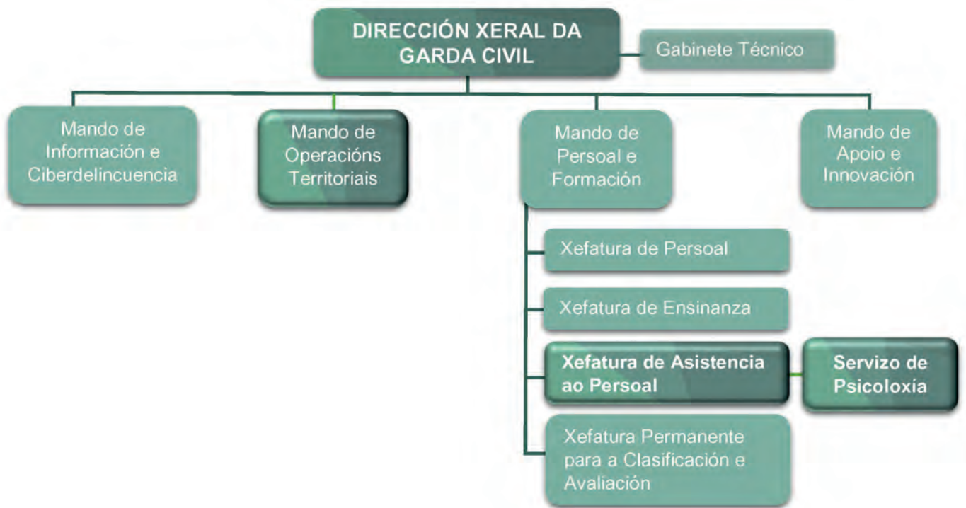
Figura 4. O Servizo de Psicoloxía na estrutura da Garda Civil. Real Decreto 770/2017, de 28 de xullo.