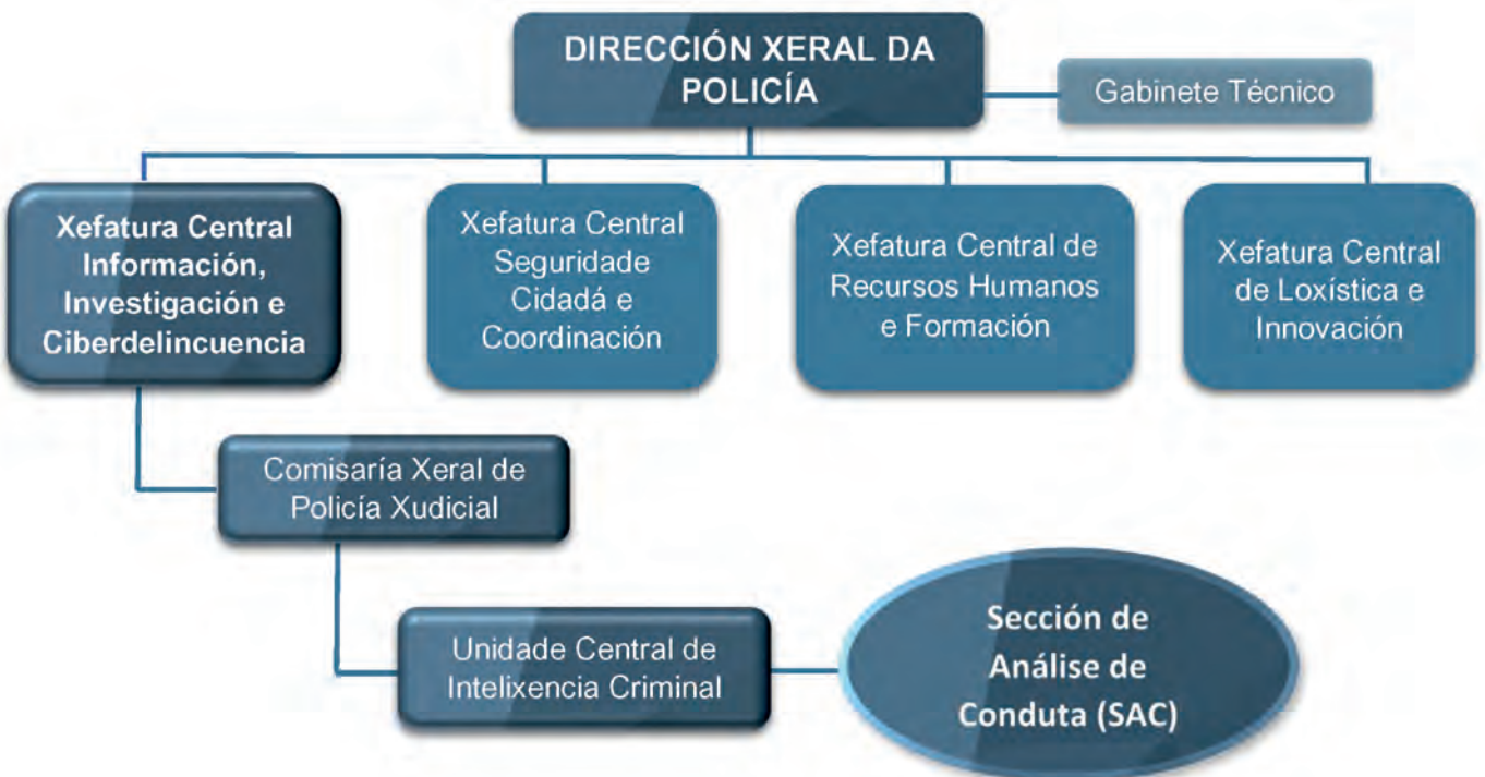
Figura 2. A Sección de Análise de Conduta (SAC) na estrutura do Corpo Nacional de Policía. Real Decreto 770/2017, de 28 de xullo.