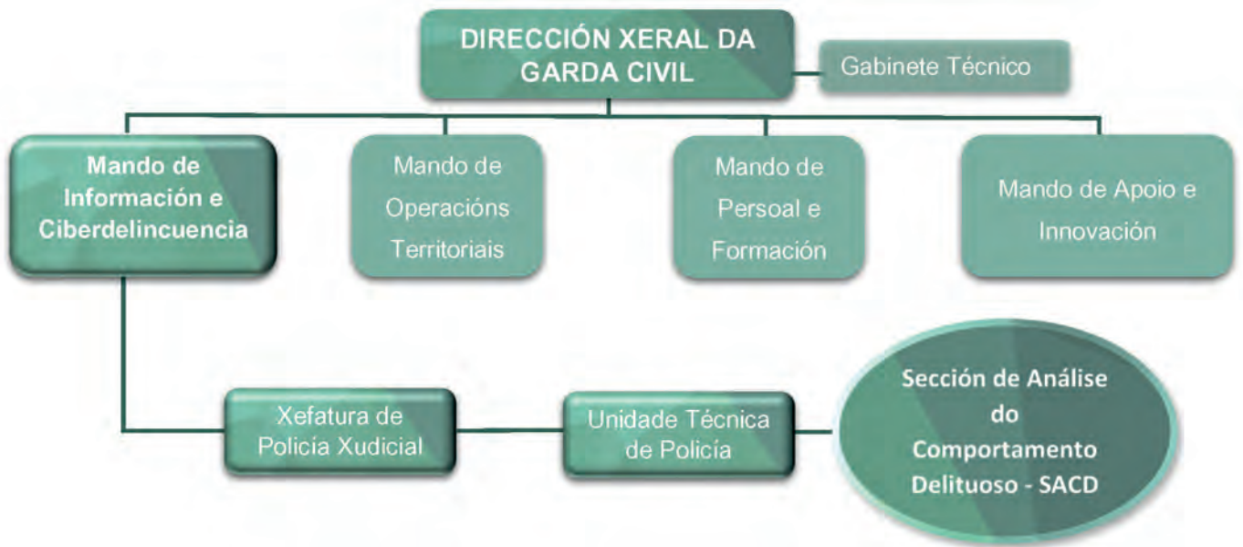
Figura 1. A Sección de Análise do Comportamento Delituoso (SACD) na estrutura da Garda Civil. Real Decreto 770/2017, de 28 de xullo.