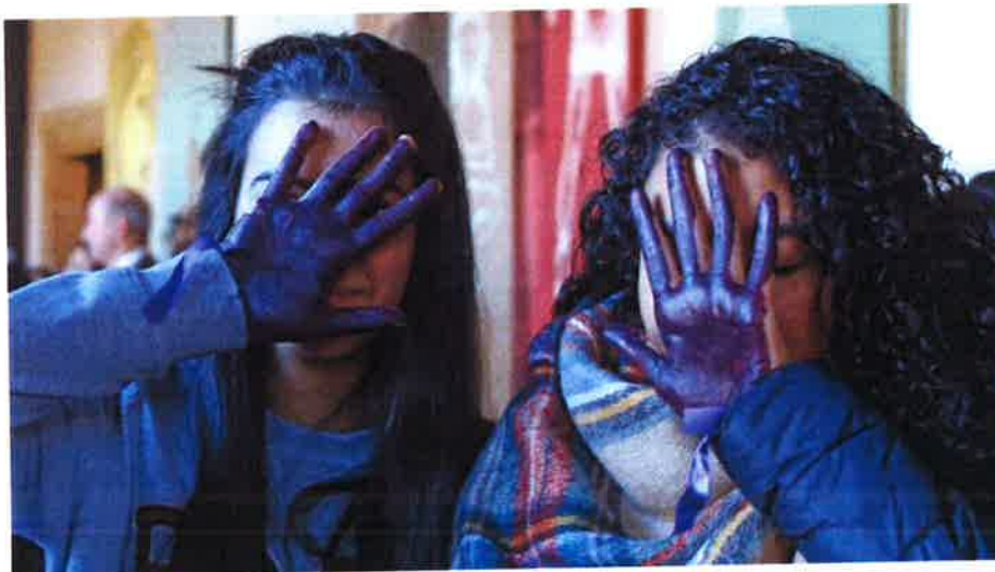
Dos jóvenes muestran sus manos teñidas de violeta en repulsa de la violencia machista

• Abogan por construir nuevas masculinidades abiertas a las tareas de cuidado y a la emoción