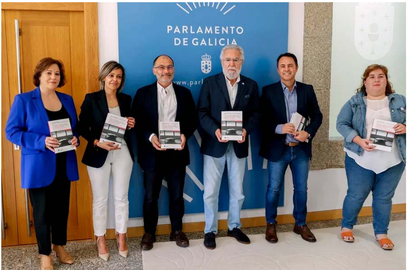
El presidente del Parlamento de Galicia, Miguel Ángel Santalices, (c) recibe a los académicos e investigadores Antonio Rial Boubeta (5i) y Manuel Isorna (3i) que le presentaron el libro ‘Sumisión química y uso de sustancias psicoactivas en las agresiones sexuales’ del que son coordinadores, este lunes en Santiago de Compostela.

El experto apunta a que los estudios y los datos aportados por las instituciones coinciden en que han aumentado las denuncias en los últimos años por agresiones sexuales pero que siguen sin denunciarse el 80 % o el 90 % del total de la casuística.