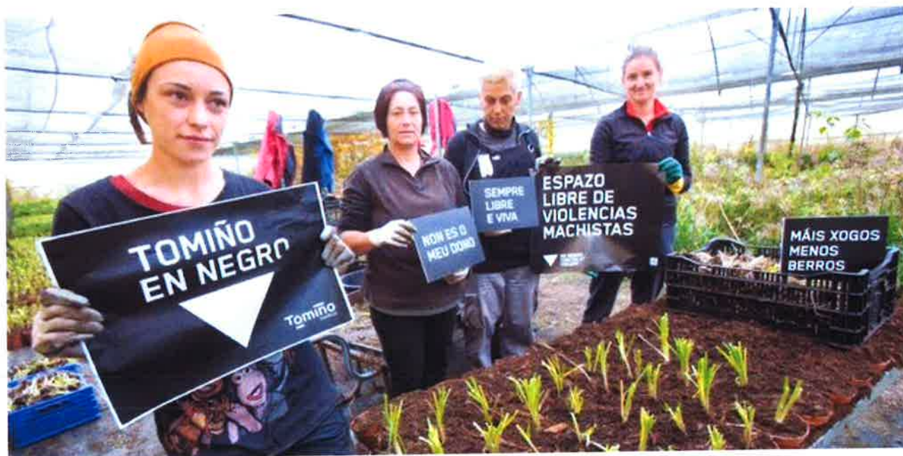
Trabajadoras de un vivero en Tomiño

Y, de igual manera, el Colegio oficial de Psicología organiza las IX Jornadas Estatales de Psicología contra la Violencia de Género. Precisamente el Colegio de Psicología de Galicia difundió este viernes una declaración institucional con motivo del 25 de noviembre en el que señalan que "como profesionales de la psicología demandamos un compromiso real, que aborde la violencia de género de forma integral, con políticas preventivas y de intervención psicológica desde las más tempranas edades, para poder erradicar las desigualdades sobre las que se asienta la violencia machista".