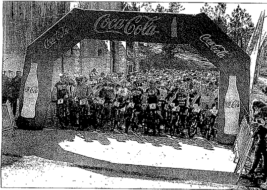
El minuto de silencio guardado ayer en la Transgalaica de Tui.