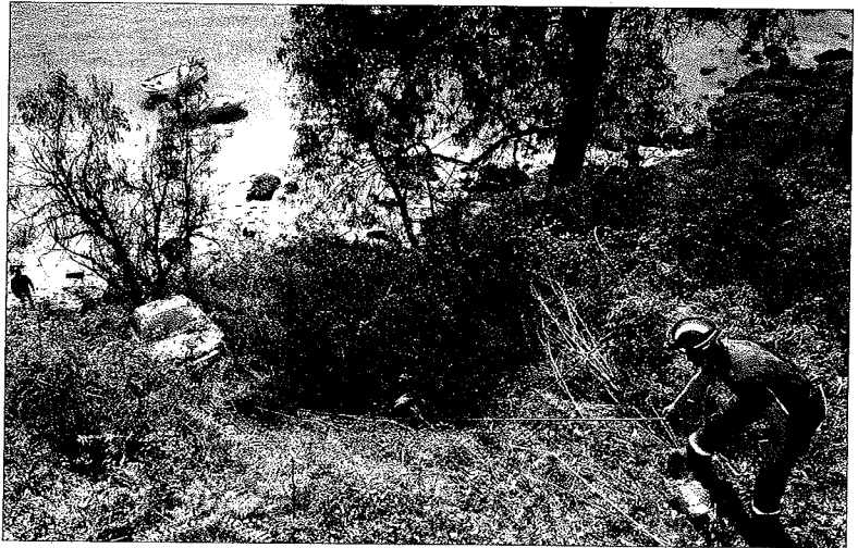
Un bombero fija el coche accidentado para poder excarcelar a la conductora.

Los ciclistas no se explican cómo pudo ocurrir el accidente en una zona con buena visibilidad. Niegan que el grupo se echara contra el vehículo, como testificó el autor del atropello, de 86 años y vecino de Nigrán. "Tuvo que ser un despiste, se puso nervioso al ver tantos ciclistas. ¿Qué puedes pensar excepto eso?", se pregunta Fernández.