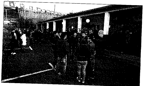
El tanatorio del Miñor, abarrotado ayer de vecinos.

Su funeral tendrá lugar hoy en la iglesia de Santiago de Parada. La comitiva fúnebre partirá a las 18.30 horas de la sala de velaciones de Sabaris hacia el citado templo, donde se oficiarán las exequias de cuerpo presente. Después, sus restos se trasladarán a Vigomemorial, donde serán incinerados en la intimidad familiar.