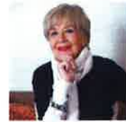
Concha Velasco, Premio Nacional de Teatro: 'Sigo siendo un referente'

"Ningún actor nacional garantiza una taquilla" - "Lars von Trier no es misógeno, es un tímido..."