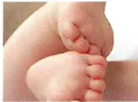
La nutrición puede influir en la salud futura AlmiiClub