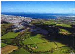
Los paisajes más extraños de Irlanda