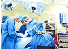
Un pedo de una paciente causa un incendio en un quirófano