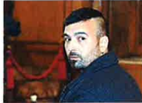
Un porriñés se declara culpable de agredir sexualmente a una vecina y alega que estaba "muy"