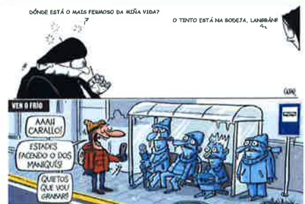
Las viñetas de FARO