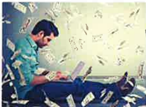
Cómo ganar dinero con un blog I&T Digital Guide