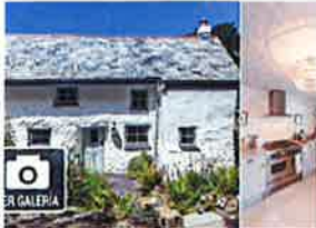
Una casa de más de 300 años totalmente reformada