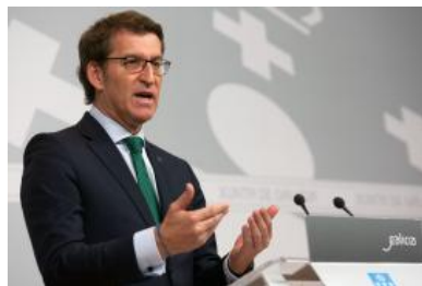
O presidente da Xunta na rolda de prensa de Consello

Santiago, 4 de febreiro de 2016.- O presidente do Goberno galego, Alberto Núñez Feijóo, avanzou hoxe que os Orzamentos da Xunta para este mesmo ano consignan unha partida de máis de 60 millóns de euros para a posta en marcha do Plan de seguridade viaria de Galicia 2016-2020, que prevé reducir á metade as vítimas mortais nas estradas galegas con respecto ao ano 2011 e un investimento próximo aos 300 millóns de euros durante a súa vixencia.