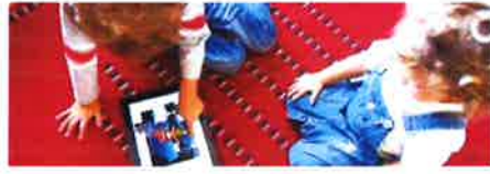
Dos niños juegan con una 'tablet'.

Series de dibujos animados, canciones para aprender inglés, muñecas que viven sus propias aventuras 'online', marcas que explican cómo jugar con sus 'artículos estrella' o niños que cuentan su día a día en la Red a través de vídeos? Los contenidos dirigidos para niños de YouTube son tan variados como la cantidad de canales infantiles de una plataforma cada vez con más éxito entre los pequeños. Expertos gallegos no ven reparos en que los niños consuman vídeos como forma de ocio, pero eso sí, siempre que el contenido haya sido seleccionado por los padres, que deben estar presentes durante el visionado y sin olvidar que internet no puede centrar el tiempo libre de los menores