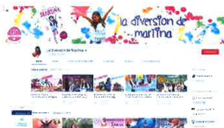
Pequeñas 'estrellas' de la Red

Prueban nuevos juguetes, plantean retos a los internautas, realizan recetas o simplemente cuentan cómo les ha ido en el cole nuevo, en la fiesta patronal de su pueblo o con su disfraz de Halloween. YouTube cuenta con cientos de canales infantiles, donde los protagonistas son los propios niños. Pese a que muy pocos triunfan, algunos han logrado contar con millones de seguidores sin haber rebasado los 10 años. Los psicólogos alertan de que ser niño 'youtuber' tiene muchos riesgos ya que el menor no está preparado para posibles críticas u ofensas y puede generarse falsas expectativas de futuro