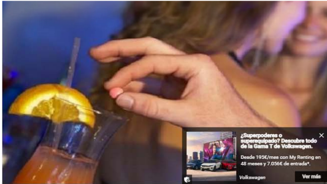
▲ En el 90% de los casos las víctimas son mujeres

Dos profesores de la Universidad de Vigo publican un manual que trata este problema de forma "multidisciplinar"