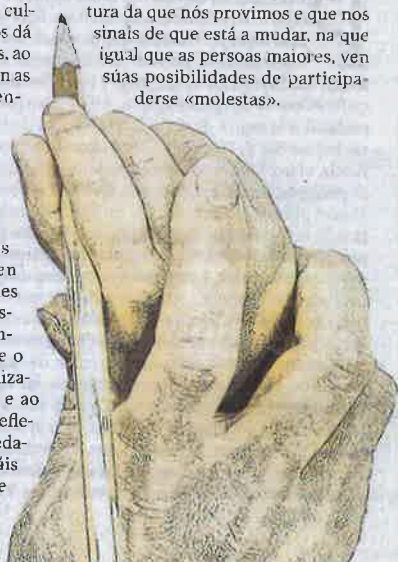
ILUSTRACIÓN MARÍA PEDREDA

Lembro un compañeiro psicólogo que dicía que antes os nenos e as nenas eramos fillos de todo o barrio. Hoxe, que a infancia constitúe un ben escaso e que a natalidade é un dos problemas graves que afronta Galicia, quero pensar que ese rexeitamento a compartir espazos con nenos e nenas se debe máis a unha estratexia de mercado que a un cambio no modelo social. Porque precisamos da tribo enteira para educar, como di o famoso proverbio africano.